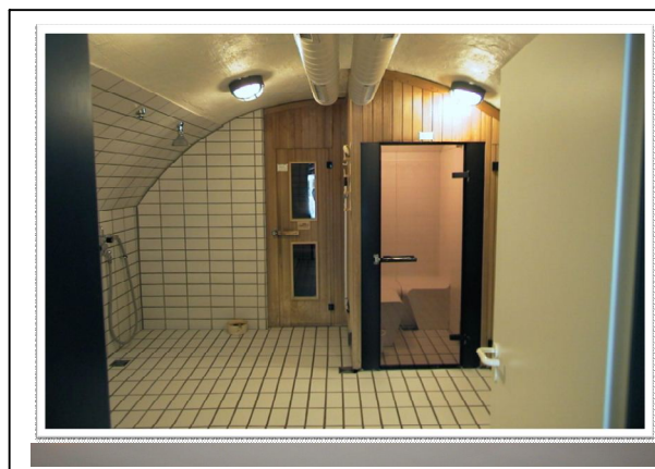
Sauna / Massagen